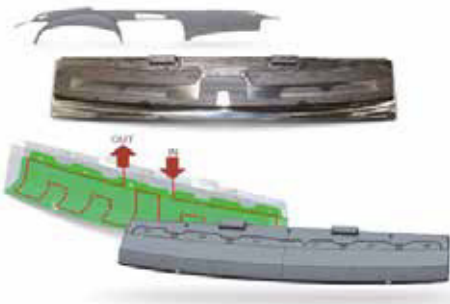
Spritzgießen eines Armaturenbretts

Das Einbringen von 3D-Kühlkanälen mittels DMT®-Technologie ermöglicht nicht nur die Herstellung komplexer 3D-Druckgeometrien, sondern auch signifikante Qualitätssteigerungen .