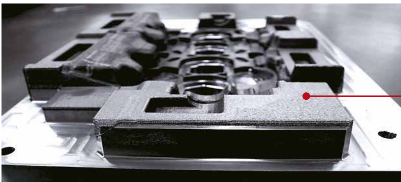
Motorenschmierung: Zylinderkopf Niederdruckform